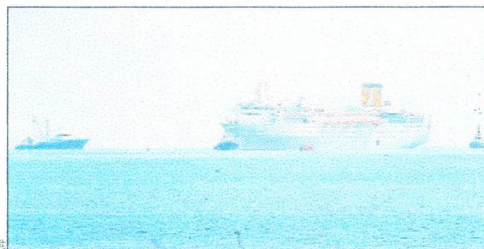
Jeudi matin, à l'arrivée du convoi au port de Victoria, les remorqueurs seychellois ont pris le relais du thonier « Trevignon » (ici à gauche) pour mener l'accostage.